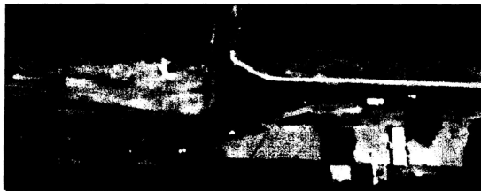
Ilustración 1: Acceso H. Irigoyen

Dicha obra cumplirá la función de ordenar el tránsito y mejorar las condiciones de seguridad vial en la intersección de la Ruta Provincial.