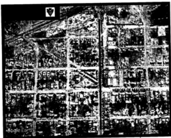
FIG. 1 - SECTOR A INTERVENIR

SECTOR A INTERVENIR = 9 DE JULIO ENTRE LIMITE CON RUTA NAC N° 23 Y HEROES DE MALVINAS.