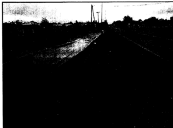
FIG. 4 - CALLE 9 DE JULIO E/ LIMITE RN23 Y H. DE MALVINAS