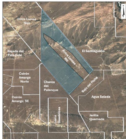
Figura 1. Área seleccionada a reconvertir (sombreada en color celeste).